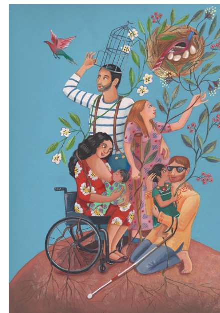
Illustration Eléonore Despax

UNIVERSITÉ LYON 2 5 Ave Pierre Mendès-France 69500 BRON